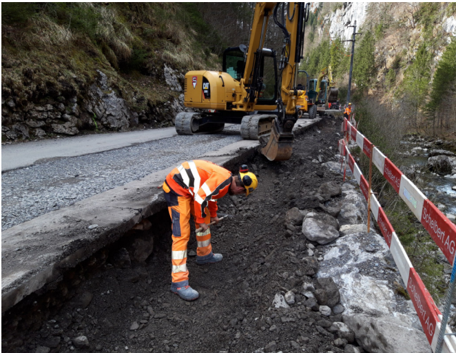
TS2: Randbord abgebrochen und Aushub für neues Randbord zw. Euschen- und Zwingsbrücke