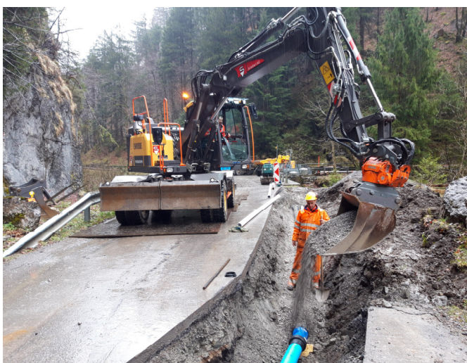
TS2: Laufende Auffüllung des Grabens der Wasserleitung