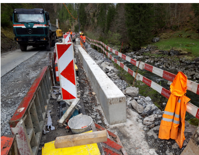
TS2: Fertig erstellte Etappe des neuen Randbordes