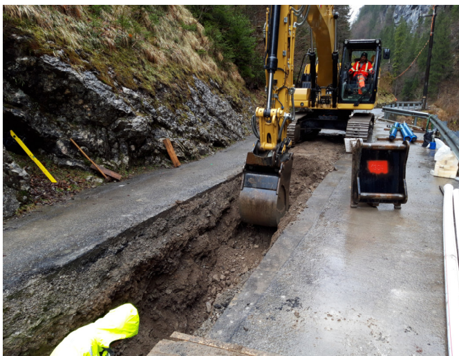
TS2: Aushub für die neue Wasserleitung in Arbeit