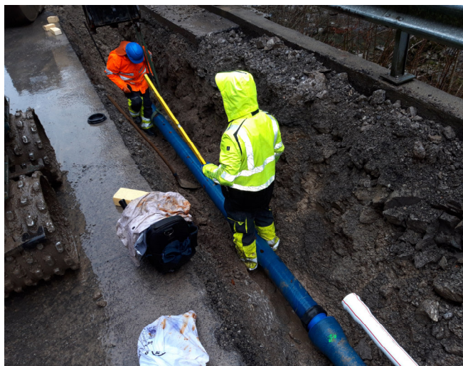
TS2: Verlegen der Wasserleitung durch die WGM