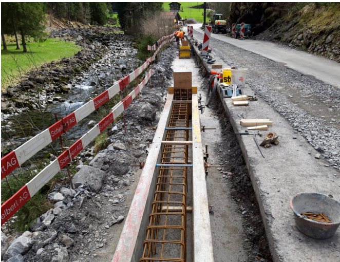
TS2: Fertig verlegte Bewehrung der 1. Etappe der neuen Randborde zw. Euschen- und Zwingsbrücke