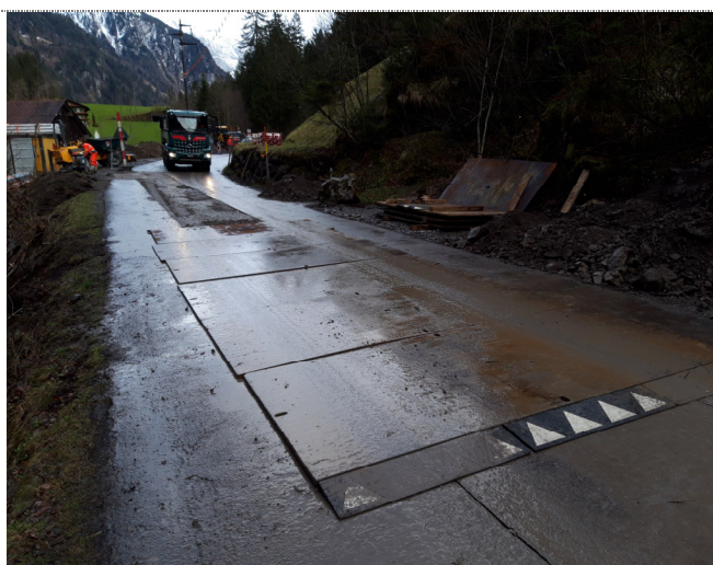
TS2: Am Abend ist der Graben aufgefüllt oder mit Grabenblechen abgedeckt