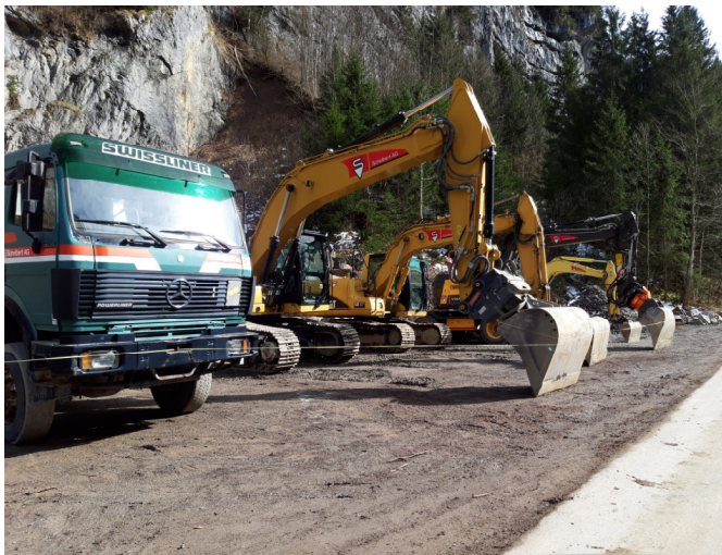
Cholplatz: Die Schelbert AG ist parat für die Arbeiten an der Teilstrecke 2 (vor den Tagessperrungen)