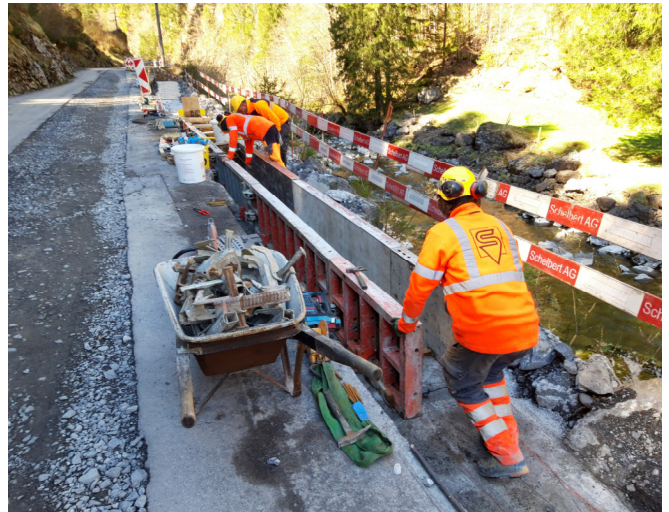
TS2: Schalung für neue Randborde zw. der Zwings- und Euschenbrücke in Arbeit