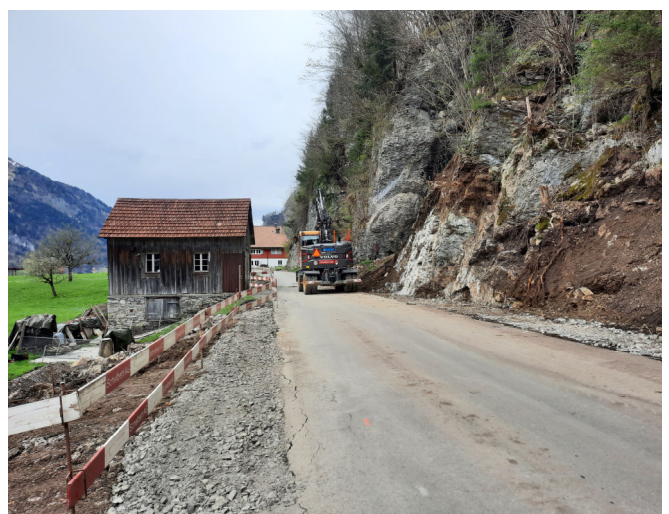
TS1: Felsabtrag im Bereich des Brennhüttlis, Balm