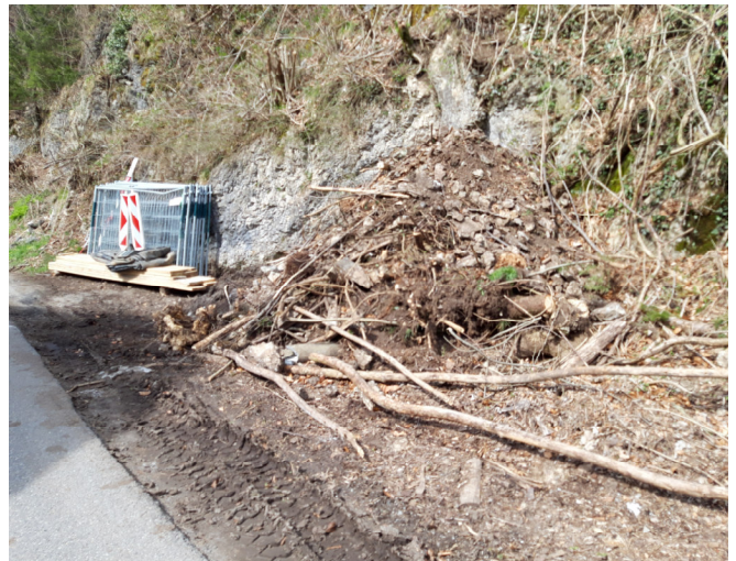
TS1: Schutthaufen nach der 1. Etappe der Felssäuberung im Bereich Balm