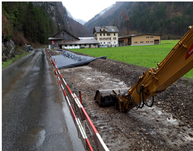
TS1: Erstellung der Verbreiterung für die provisorische Verkehrsführung