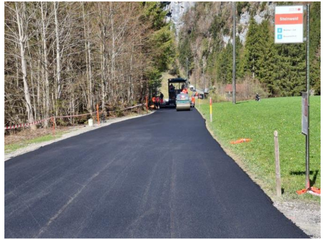
TS 2 am 16.04.2026: Deckbelagseinbau Steinweid.