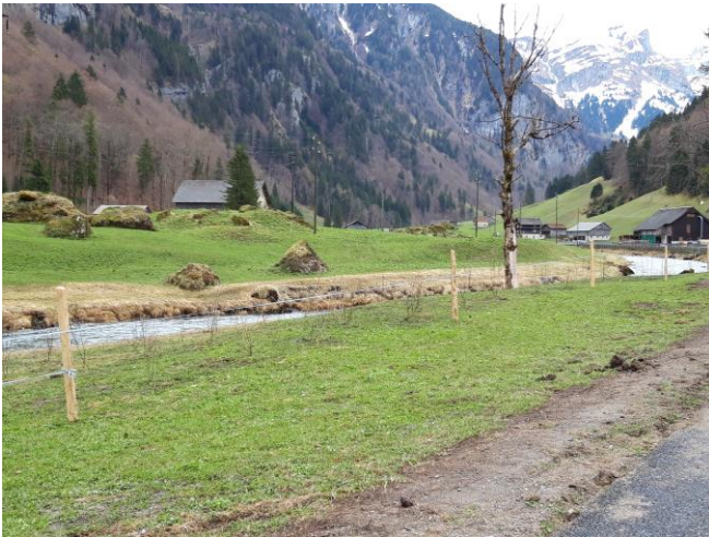
TS 2 am 09.04.2026: Ersatzmassnahmen Aufforstung Laui.