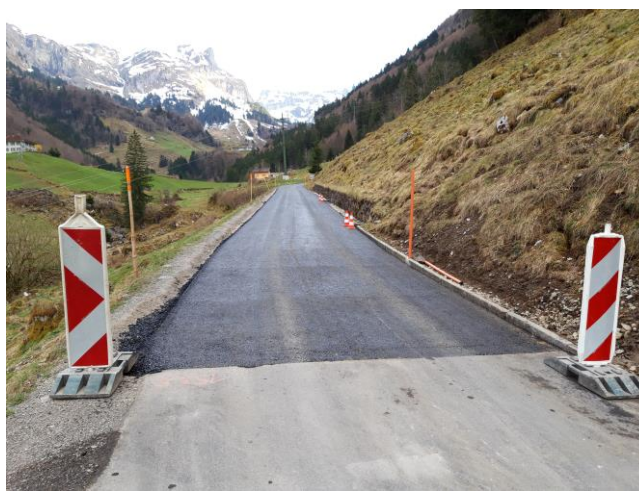
TS 2 am 09.04.2026: Belagsersatz Tragschicht der 2. Etappe zw. Schönenboden und Gigenbach.