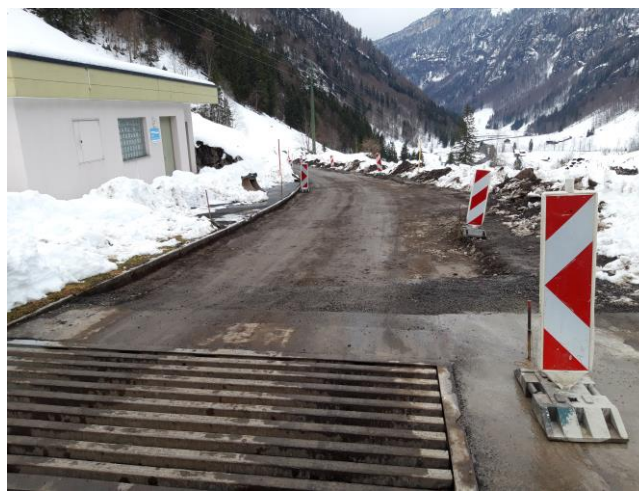
TS 2 am 01.04.2026, Etappe Schönenboden bis Gigenbachbrücken: Belagsrückbau 1. Etappe abgeschlossen.