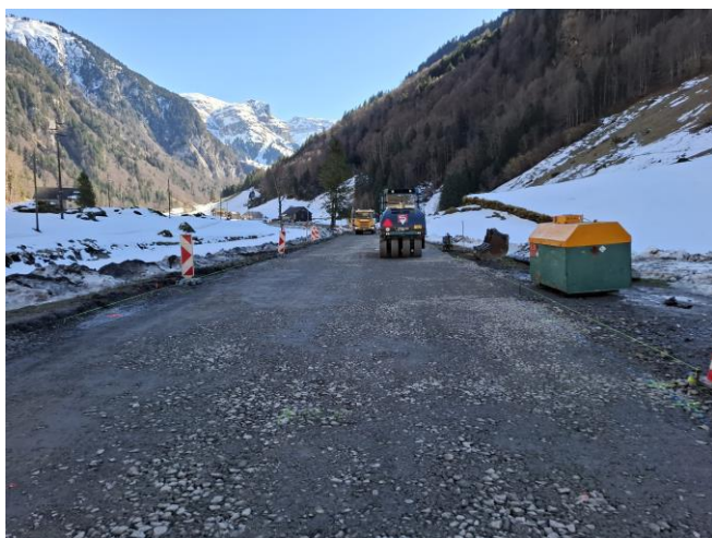
TS 2 am 27.02.2026, 1. Etappe Laui bis Bergli: nach lokalem Fundationsersatz wird die Planie vorbereitet für den Tragschichtersatz im Bereich Laui.