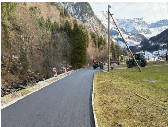
TS 2 am 17.03.2026, Zwischenstück: Belagsersatz im Bereich Mettlen / Wasserbergstrasse. Wetterumschwung Ende April; Schneefall ab 25. März 2026.