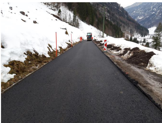
TS 2 am 02.04.2026: Belagsersatz Tragschicht der 1. Etappe zwischen Schönenboden und Gigenbach.