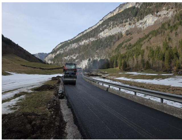
TS 2 am 05.03.2026: Belagseinbau (Tragschichtersatz) der 2. Etappe im Bereich Bergli.