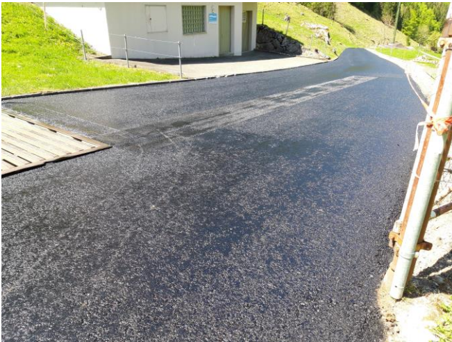
TS 2 am 27.04.2026: Vorbereitungsarbeiten für Deckbelag im Bereich Schönenboden bis EBS-Zentrale Seeberg; Asphaltbewehrung kleben und Haftvermittler aufspritzen.