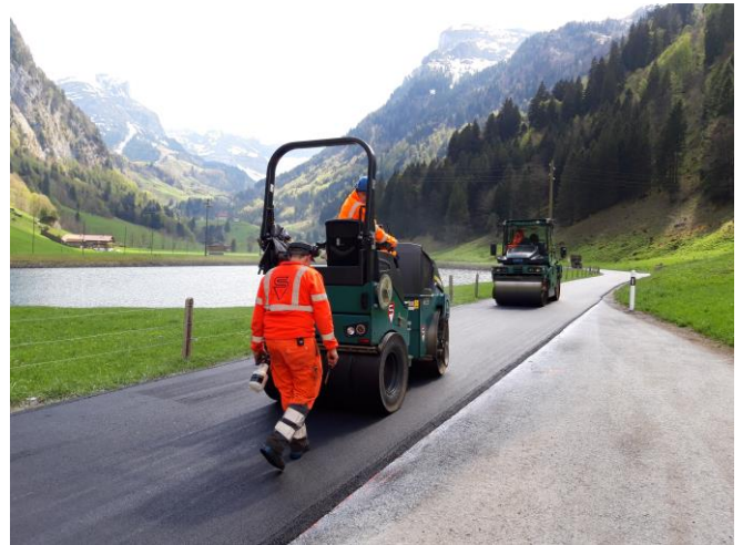
TS 2 am 21.04.2026: Deckbelagseinbau im Bereich Seeberg bis Mettlen.