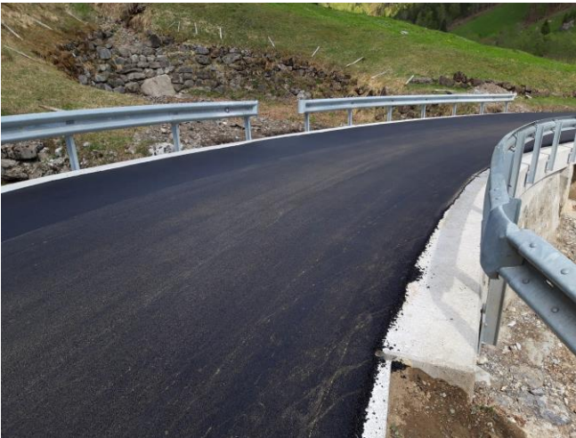
TS 2 am 21.04.2026: Deckbelagseinbau im Bereich der unteren Gigenbachbrücke. Der Belag ist bündig mit Oberkant Randbord resp. leicht überbaut.