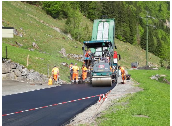
TS 2 am 28.04.2026: Deckbelagseinbau Schönenboden bis EBS-Zentrale.