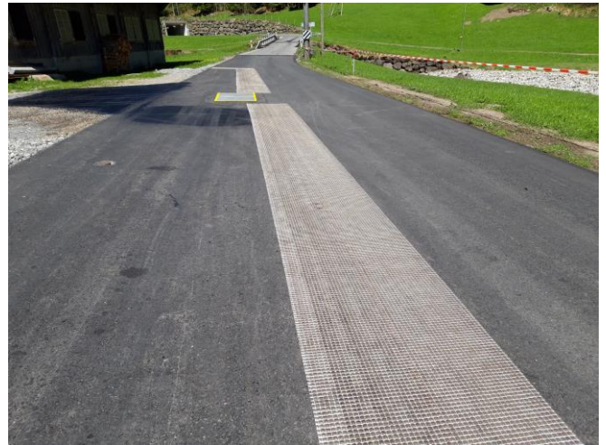
TS 2 am 23.04.2026: Vorbereitungsarbeiten vor Deckbelagseinbau wie z.B. Asphaltbewehrung bei Fugen in Tragschicht anbringen.