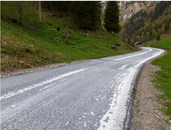
TS 2 am 20.04.2026: Auftrag Haftvermittler und Kalkmilch vor Deckbelagseinbau im Bereich Mettlen bis Seeberg.