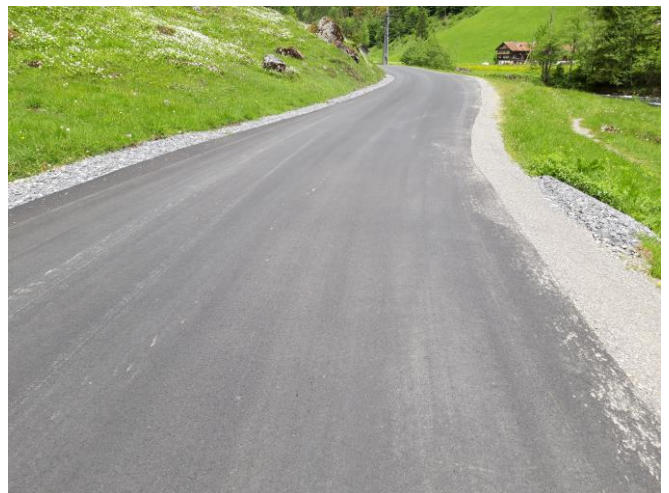
TS 2 am 19.05.2026: Vorabnahme Teilstrecke 2: Sickerpackung bergseitig und Kiesbankett im Bereich Seeberg.