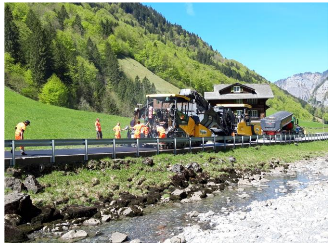
TS 2 am 24.04.2026: Deckbelagseinbau im Bereich Seeberg bis Mettlen.