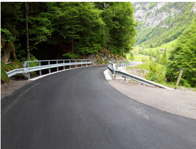
TS 2 am 19.05.2026: Vorabnahme Teilstrecke 2: Obere Gigenbachbrücke.